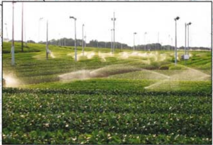
スプリンクラーかん水