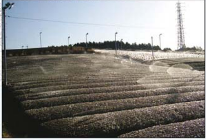
凍霜害防止(散水氷結法)