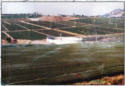
農地造成地と県営ファームボンド